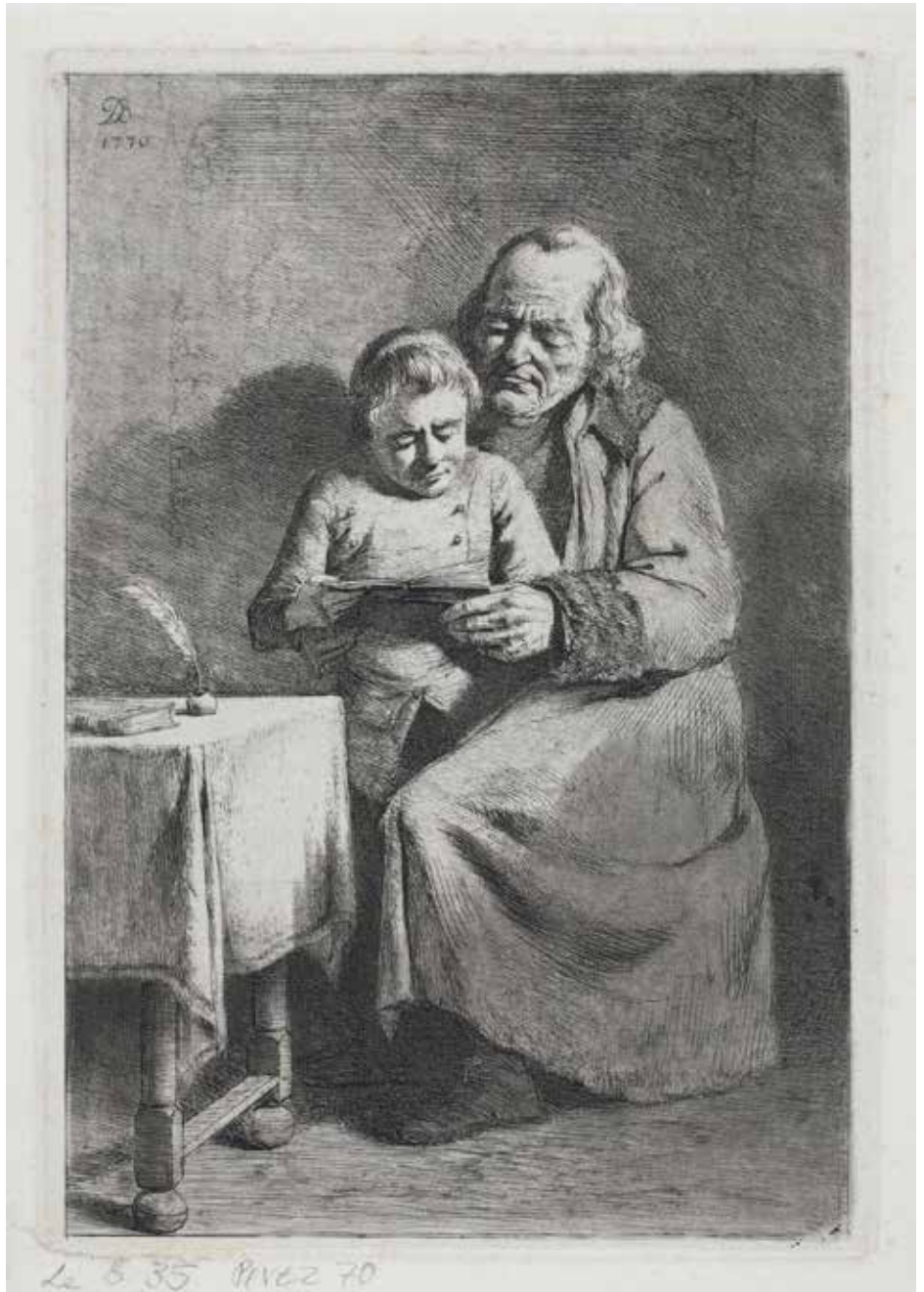
Jean-Jacques de Boissieu.