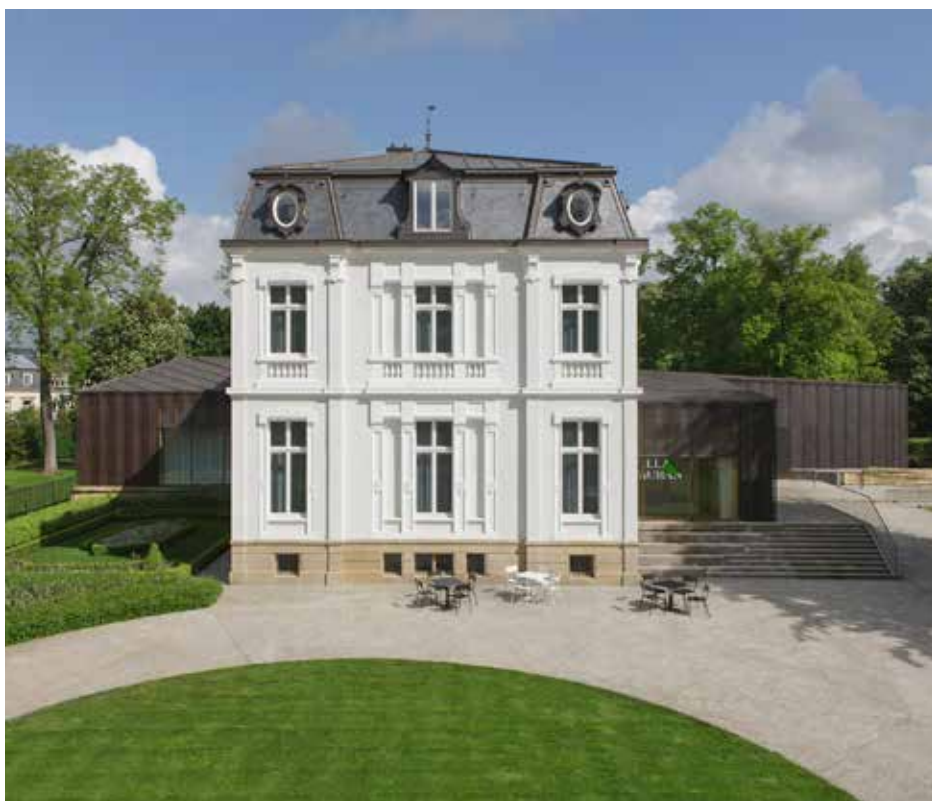
Villa Vauban