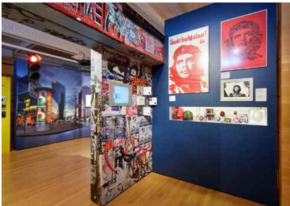
Vue de l'exposition Signes – Un langage sans parole .

Style vestimentaire, signes gestuels, uniformes et tatouages : nous rencontrons les signes à chaque pas dans notre quotidien. Ils renvoient aux règles, aux coutumes, indiquent l'appartenance sociale, représentent nos conceptions du monde et symbolisent les rapports de pouvoir. La fondation Haus der Geschichte der Bundesrepublik Deutschland leur a consacré une exposition : après Bonn, Leipzig et Berlin, celle-ci rend visite au Grand-Duché de Luxembourg, dans une version enrichie d'exemples locaux.