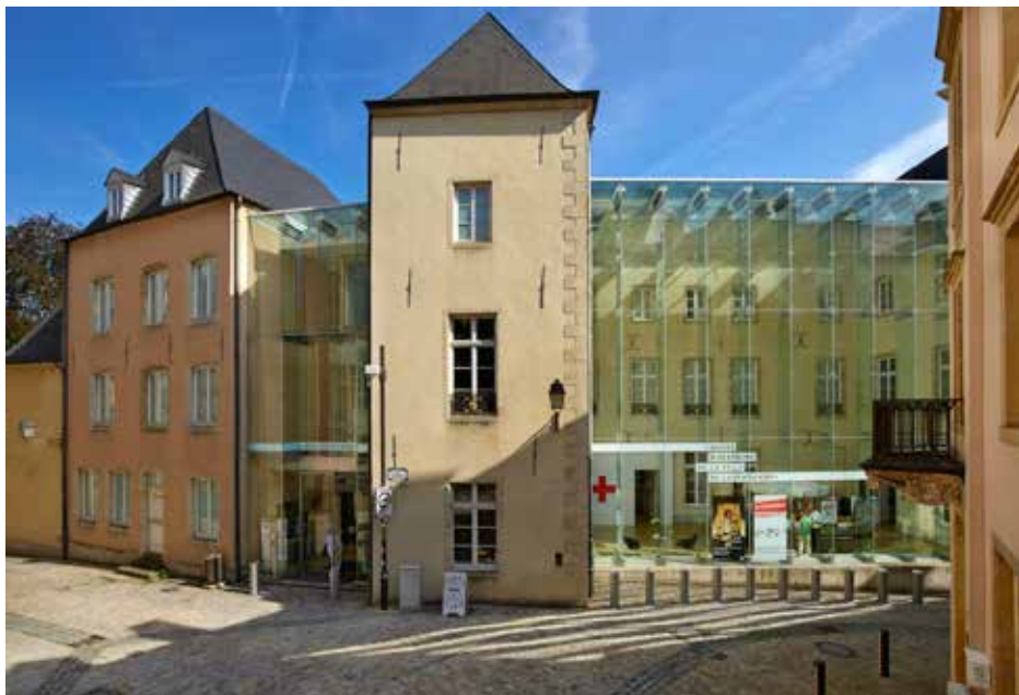
Musée d'Histoire de la Ville de Luxembourg.

Le Musée d'Histoire, situé au cœur de la vieille ville, fut inauguré en 1996. Le site retenu pour abriter le Musée est un ensemble restauré de quatre anciennes maisons bourgeoises, datant des XVII e , XVIII e et XIX e siècles et comprenant des vestiges remontant jusqu'au Moyen Âge. Deux exemples de l'adaptation réussie de l'architecture ancienne aux exigences de la modernité sont la verrière « flottante » et l'ascenseur panoramique qui traverse le musée sur toute sa hauteur, ouvrant au visiteur des perspectives spectaculaires. La verticalité, reflet de la configuration de la ville caractérisée par le contraste entre ville-haute et ville-basse, est transposée dans la structure même du musée qui comporte 8 niveaux, dont 6 sont ouverts au public.