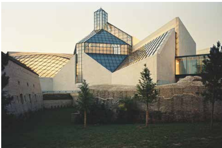
Musée d'Art Moderne Grand-Duc Jean, Mudam Luxembourg. Ieoh Ming Pei Architect Design.

La forme asymétrique en V, avec des angles à 45 degrés, s'élève sur les ruines du Fort Thüngen. Le Fort Thüngen, nommé d'après le baron Von Thüngen, commandant autrichien de la forteresse, est construit en 1732 d'après des plans dessinés en 1688 par Vauban. La forme introvertie de la forteresse, repliée autour de ses murs de fortification, se retrouve dans le nouveau bâtiment de Ieoh Ming Pei. La géométrie du musée est ainsi une sorte de continuation de la forteresse. Le contraste avec celle-ci est d'autant plus intéressant que Pei compose son bâtiment avec des volumes très géométriques, adoptant des formes à la fois modernes et classiques. Son architecture est formaliste, tout en étant sobre et monumentale. Construit en pierre de Bourgogne, le Mudam Luxembourg intègre une structure de métal et de verre dont la flèche s'élance à près de trente mètres de hauteur. En 1997, le projet pour la construction du Musée d'Art Moderne Grand-Duc Jean est officiellement adopté sous les ministères de Robert Goebbels et d'Erna Hennicot-Schoepges. Le chantier débute officiellement le 22 janvier 1999.