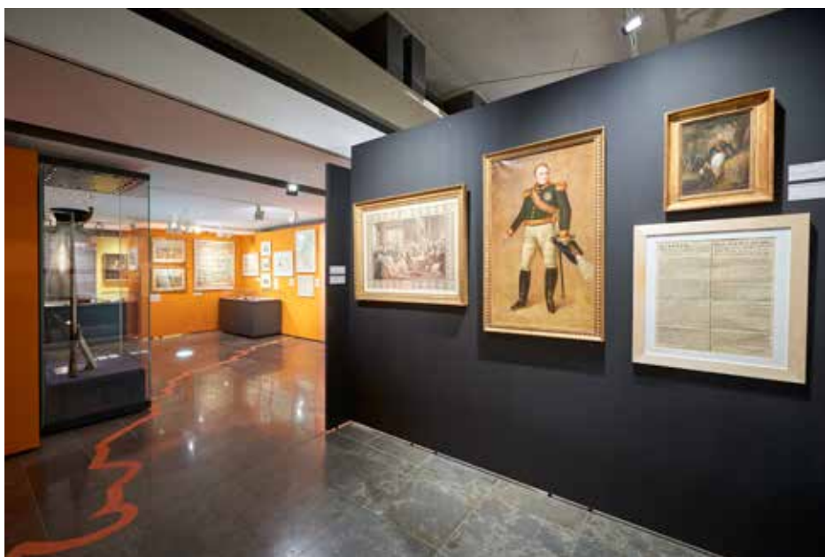
Vue de l'exposition Les frontières de l'Indépendance : Le Luxembourg entre 1815 et 1839 .

Le 9 juin 1815, l'Acte Final du Congrès de Vienne crée le Grand-Duché de Luxembourg, sur les cendres encore fumantes de l'ancien Département des Forêts de l'empire de Napoléon. À l'occasion de son bicentenaire, le Musée Dräi Eechelen place l'original de ce Traité, qui forgea l'Europe actuelle, au départ d'une grande exposition. Véritable enquête historique, elle illustre comment les frontières du Luxembourg ont été dessinées et comment les habitants du Grand-Duché ont vécu ces événements jusqu'à l'Indépendance en 1839. Elle nous replonge dans cette première moitié du XIX e siècle, époque d'une importance capitale sur le chemin de l'Indépendance luxembourgeoise. Ses acteurs, leurs projets, leurs réalisations et leurs utopies évoluent au fil de l'histoire des frontières.