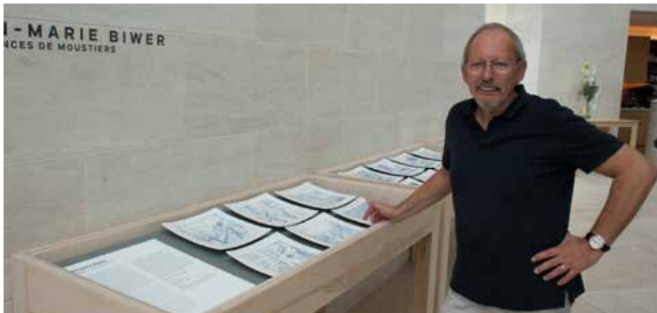
Jean-Marie Biwer

Jean-Marie Biwer a réalisé les vingt-deux pièces qui composent cette série pendant l'hiver 2014 à Moustiers-Sainte-Marie, petit village des Alpes-de-Haute-Provence célèbre depuis le XVII e siècle pour ses ateliers de céramique.