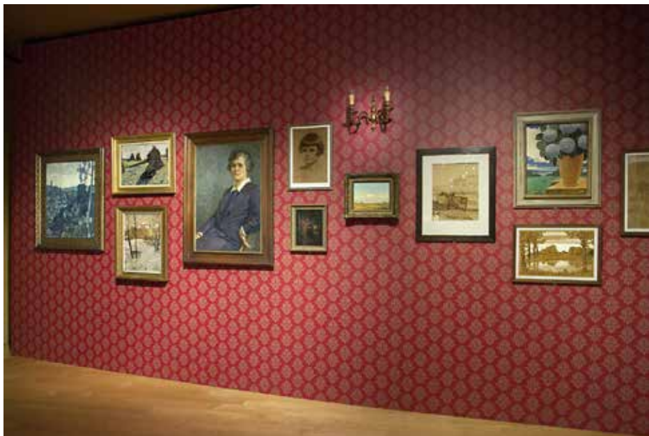
Vue de l'exposition Le musée chez soi – Une collection d'art luxembourgeois du XX e siècle .

L'exposition présente une collection d'œuvres d'artistes luxembourgeois du XX e siècle, réunie par un habitant de la ville de Luxembourg entre les années 1950 et 1980 et représentative à plus d'un égard.