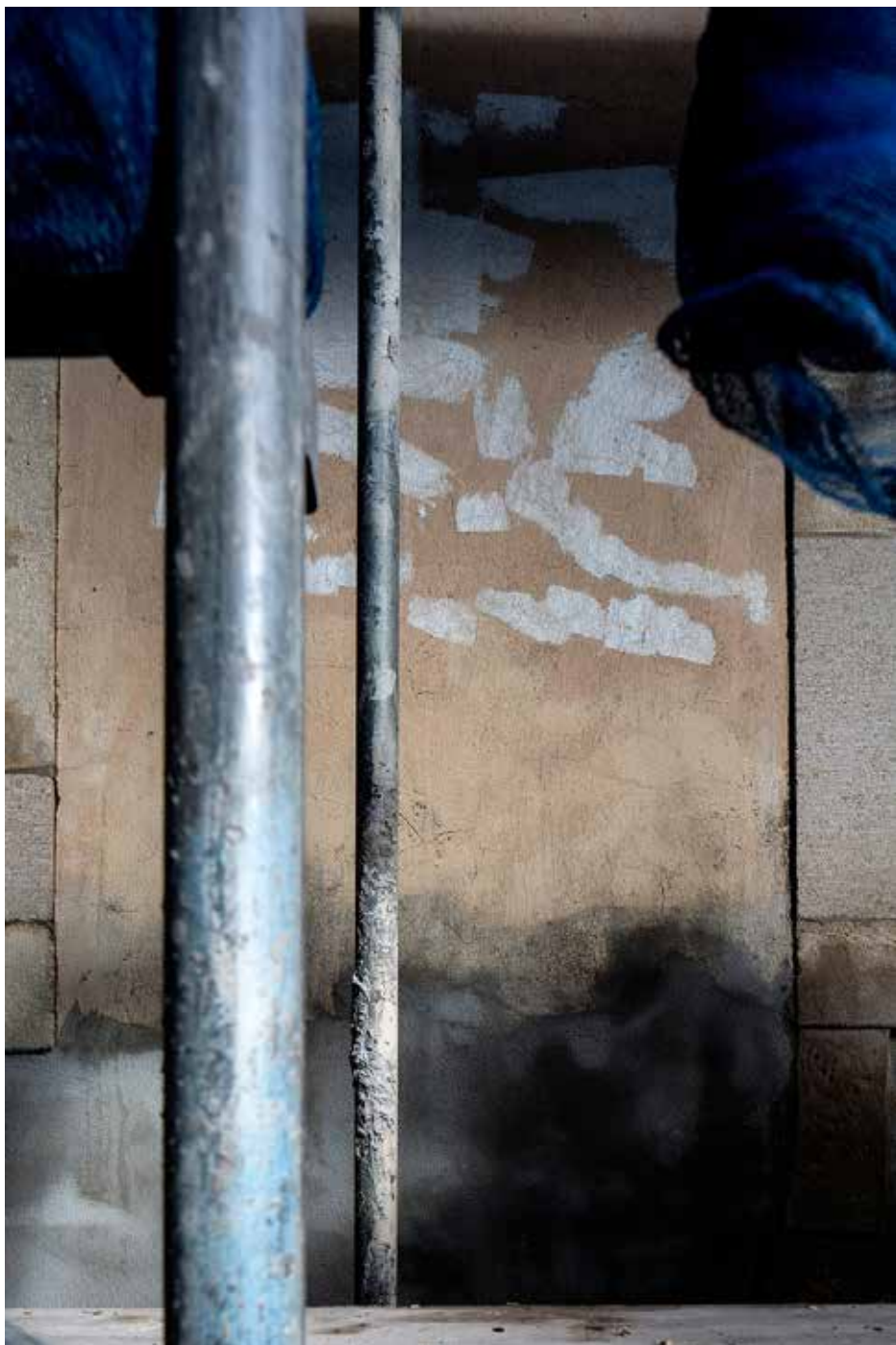
Eric Chenal, Sans titre , 2014.

Selon le scénographe Antonin Pons Braley, « il ne s'agit pas de représenter la même configuration servie par un discours, mais bel et bien de repenser les fondements du propos d'origine, ses origines, sa matrice. Cette déconstruction du propos prend la forme de balade, de parcours. En décomposant les éléments à l'œuvre, il s'agit de ramener – replier – la forme d'origine à sa plus simple expression. »