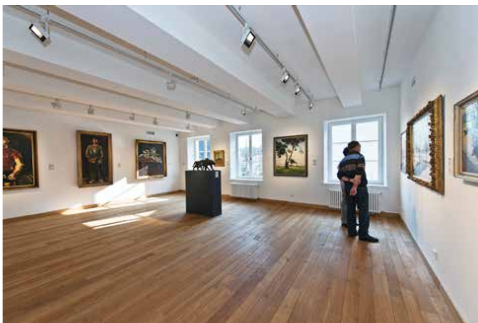
Vue de la section Beaux-Arts

Les maisons anciennes de la rue Wiltheim quant à elles bénéficient de 2012 à 2014 d'une réhabilitation intégrale menée conjointement par le Fonds de Rénovation de la Vieille Ville et le MNHA. Les architectes prennent le plus grand soin afin de minimiser l'impact des travaux sur le bâti ancien. La nouvelle passerelle à deux niveaux, entièrement vitrée, qui relie dorénavant le bâtiment central à l'Aile Wiltheim permet une nette amélioration de la circulation et des flux des visiteurs.