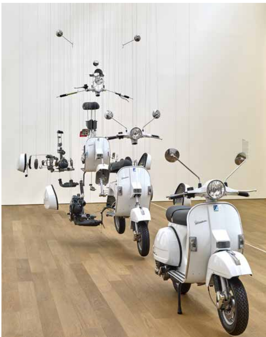
Damián Ortega, Miracolo Italiano , 2005, Collection Teixeira de Freitas, Dépôt 2006 Fundação Serralves – Museum de Arte Contemporânea, Porto © Serralves Foundation – Museum of Contemporary Art, Porto © Photo : Rémi Villaggi Metz / Mudam Luxembourg.

Investissant l'ensemble des espaces d'exposition du Mudam, elle réunit, sur le mode du dialogue, quelques soixante-dix pièces datant du XVIII e siècle à nos jours issues des prestigieuses collections du musée parisien et plus de cent trente œuvres d'artistes qui, à travers les notions qu'ils abordent, les expériences qu'ils proposent, mais aussi les modes de production et de collaboration auxquels ils recourent, se saisissent des questions qui animent les domaines de la technique et de la science depuis plusieurs siècles.