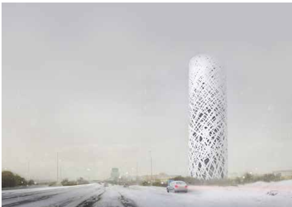
© Atelier d'architecture et de design Jim Clemes.

Dans le cadre des festivités de son 25 e anniversaire, l'OAI (Ordre des Architectes et des Ingénieurs-Conseils Luxembourg) participe par une contribution propre à l'exposition Signes – Un langage sans parole .