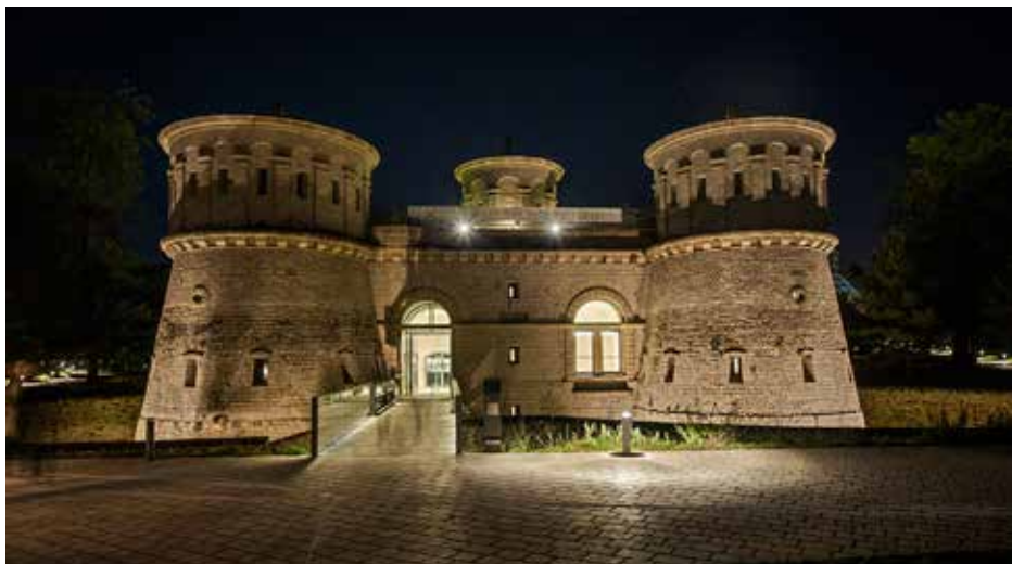
Musée Dräi Eechelen, NdM 2013

Bibliographie : BRUNS, André, Bundesfestung Luxemburg 1815-1866 , Luxembourg, 2012, 71 pages, ISBN 978-2-87985-185-3, Prix : 10 € KOLTZ, Jean-Pierre, Baugeschichte der Stadt und Festung Luxemburg in drei Bänden , Luxembourg, 1944-1951