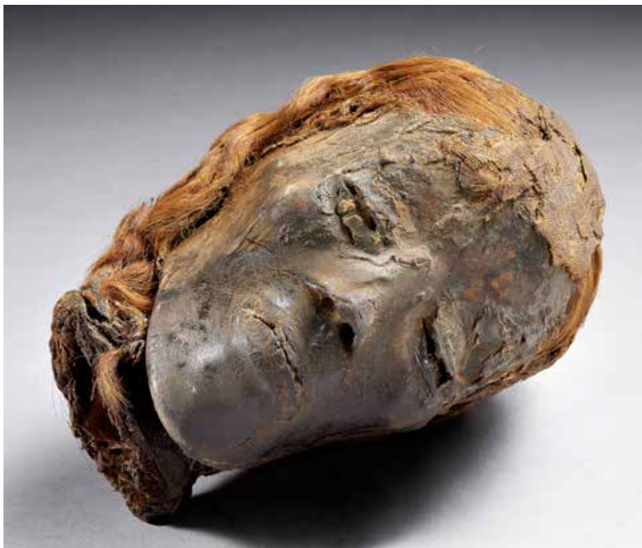
Tête de momie.

De nombreux artefacts originaux, du mobilier funéraire de grande facture, d'extraordinaires trouvailles archéologiques et les résultats de récents travaux scientifiques complètent cette exposition réalisée grâce à de prestigieux prêts en provenance d'Europe et d'outre-mer.