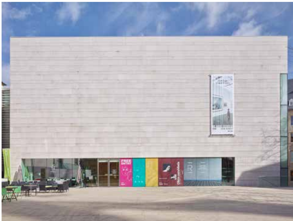
Musée national d'histoire et d'art

En 1922 l'État achète la maison Collart-de Scherff au Marché-aux-Poissons pour y installer un musée. Retardés par des problèmes de financement, les travaux de transformation conçus par Paul Wigreux ne sont achevés qu'en 1939, mais le déclenchement de la Deuxième Guerre mondiale diffère l'inauguration du musée. L'agrandissement considérable du bâtiment envisagé par l'occupant nazi est empêché par le cours de la guerre et en 1943 les collections doivent être déposées en lieu sûr. Après la fin des hostilités, la plupart des collections rentrent indemnes au musée qui ouvre ses portes au public en 1946.