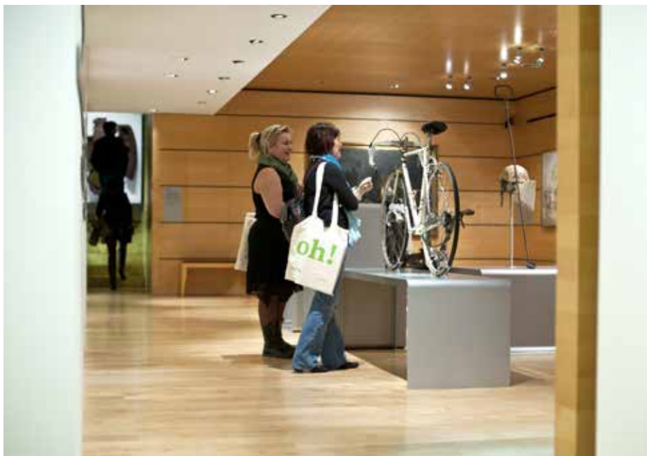
Nuit des Musées, 2011.

À l'entrée, une installation multimédia raconte la légende de la nymphe Mélusine et renvoie aux origines mythiques de la ville.