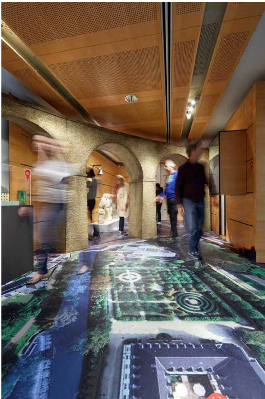
Vue de l'exposition De Pafendall – Histoires d'un quartier.

La ville de Luxembourg ne compte guère d'autre quartier dont l'histoire remonte aussi loin que celle du Pfaffenthal. En 1990, des archéologues découvrent dans le lit de l'Alzette les vestiges de la pile d'un pont datant des Romains. Des documents du haut Moyen Âge attestent que la vallée était habitée bien avant que le comte Sigefroid ne bâtit son château sur le Rocher du Bock.