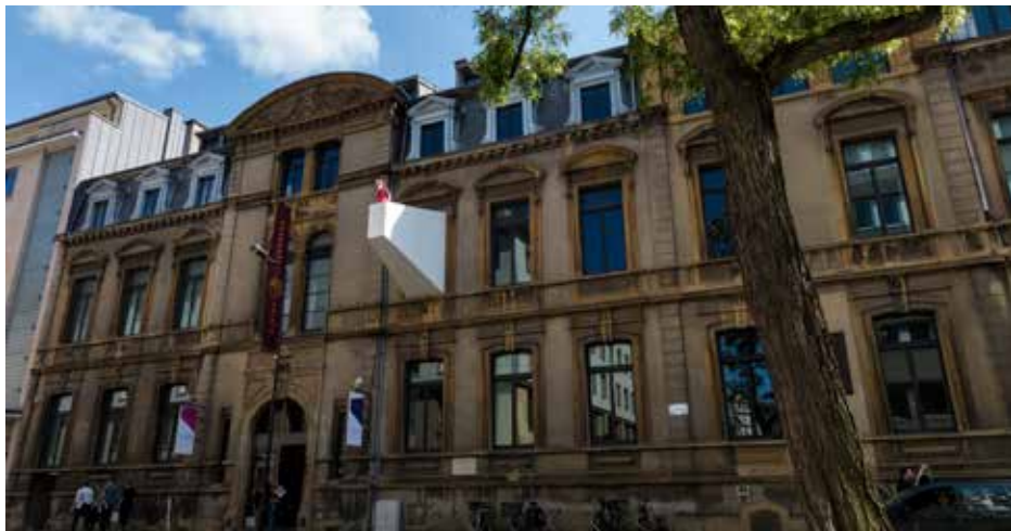
Casino Luxembourg, vue de la façade rue Notre-Dame avec Beautiful Steps #10 © Photo : Lang/Baumann, 2014.

En mai 2014, Lang/Baumann ont installé un balcon tronqué en pyramide en plein milieu de la façade nord du bâtiment, permettant ainsi un dialogue entre l'espace intérieur et l'espace extérieur. Le balcon, d'une profondeur de 3 mètres, réalisé en composite synthétique et peint en blanc, ressemble de l'extérieur à une forme géométrique fermée, à une protubérance architecturale suspendue dans le vide. Une fois à l'intérieur du bâtiment, au niveau du palier du premier étage, on se rend compte que ce « balcon » peut être utilisé pour ce qu'il est réellement.