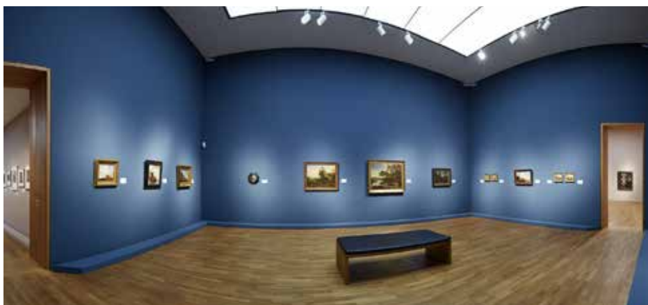
Vue de l'exposition Les collections en mouvement.

Jean Jacques de Boissieu, né à Lyon, était un des plus éminents dessinateurs et graveurs du XVIII e siècle, surnommé par certains le « Rembrandt français ». Bien que connu plutôt auprès des spécialistes du monde de l'art d'aujourd'hui, ses paysages, scènes de genre et études de caractères particulières continuent à nous fasciner. L'exposition monographique à la Villa Vauban est depuis longtemps la première consacrée à cet artiste exceptionnel.