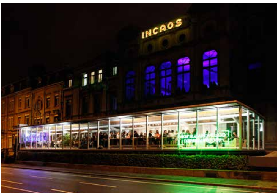
Casino Luxembourg, NdM 2013

Le bâtiment de l'actuel Casino Luxembourg fut construit en 1882 par Pierre Kemp et Pierre Funck. Autrefois appelé « Casino Bourgeois », il était un lieu privilégié de la vie culturelle et mondaine de la ville pendant des années. Au milieu du XX e siècle, l'État racheta l'édifice et le loua au Cercle Culturel des Communautés Européennes. Le Casino Luxembourg, désormais appelé « Foyer Européen », restera jusqu'à la fin de l'année 1990 le centre des manifestations culturelles et mondaines de la Communauté Européenne à Luxembourg. Lors des préparatifs de Luxembourg, Ville Européenne de la Culture 1995, la transformation de l'ancien « Casino Bourgeois » en lieu d'exposition fut confiée à Urs Raussmüller. Dans son projet architectonique il alliait de manière convaincante simplicité, esthétique et fonction pratique. La première étape consista à ramener le Casino à ses structures élémentaires. La seconde vit l'installation, dans chacune des pièces du rez-de-chaussée surélevé (à l'exception du hall central) et du premier étage, de cubes aux parois uniformément blanches, ouverts dans leur partie supérieure, laissant intacte la substance historique et offrant un maximum de surface murale. C'est en mars 1996, trois mois après la fin de l'année culturelle à Luxembourg en 1995, que le Casino Luxembourg est devenu ce qu'il est aujourd'hui : le premier et unique Forum d'art contemporain au Grand-Duché de Luxembourg.