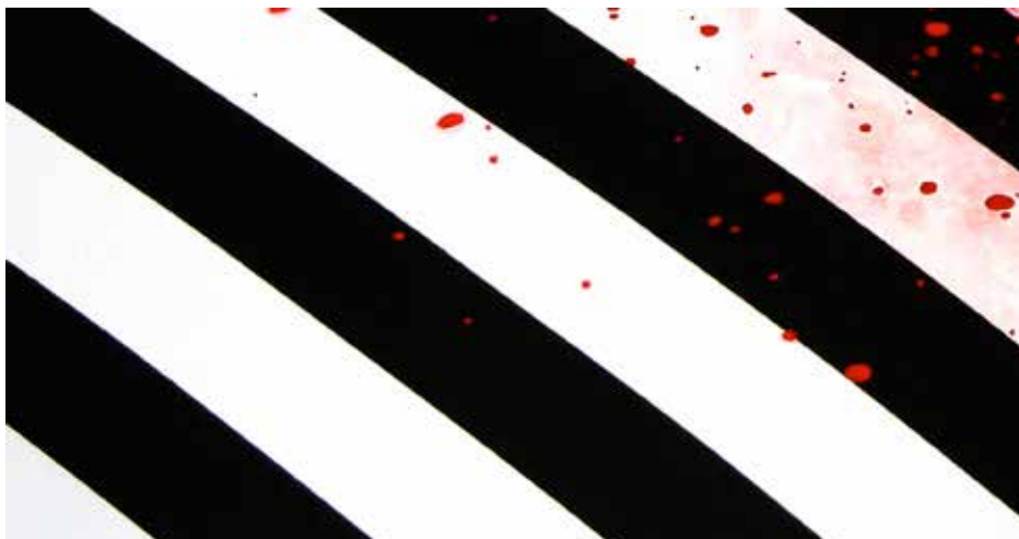
Élodie Lesourd, Tedesco and Pitman (détail), 2012, acrylique sur MDF.

Observer les moments de rencontre entre l'art et la musique ; interpréter les mythes issus de la culture rock ou underground , en manipuler les codes et symboles : tels pourraient être les leitmotivs qui jalonnent l'œuvre et le parcours d'Élodie Lesourd (1978* ; vit et travaille à Paris). Pour son exposition monographique au Casino Luxembourg, l'artiste a choisi de mettre en relation deux axes développés dans son travail au cours des dix dernières années : D'un côté, il y a ce que l'artiste qualifie elle-même d'œuvres « hyperrockalistes », à savoir des peintures à caractère hyperréaliste dans lesquelles elle reproduit méticuleusement des photographies d'installations d'autres artistes qui font référence à la culture rock. De l'autre, on retrouve des œuvres à tendance néoconceptuelle sous différentes formes.